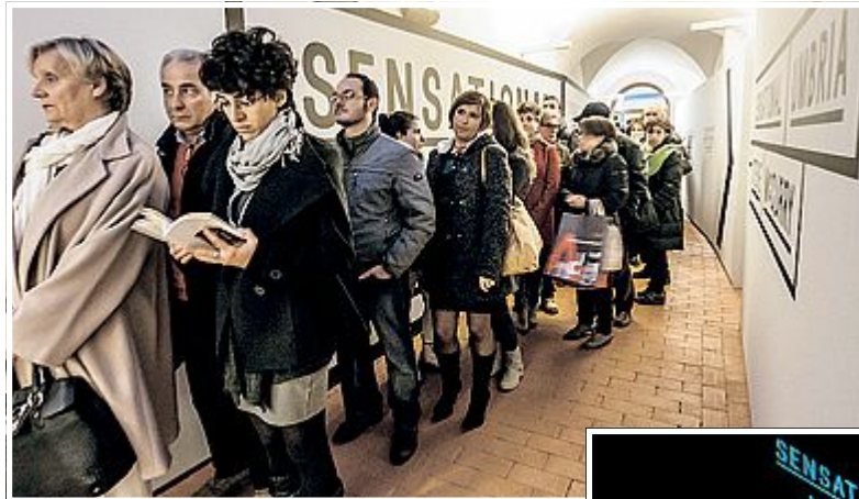
IN FILA La coda all'ingresso, i suggestivi interni e, a destra, Steve Mc Curry

Il fascino di «Sensational Umbria» è indiscu-