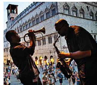
La mostra rimane aperta al pubblico fino al 5 ottobre, 2014. Da marzo a oggi, i visitatori sono stati oltre 16.000 e 1600 i cataloghi venduti.

te: la si guarda e si pensa alla "ragazza afgana", la foto "cult" pluripremiata del reporter di guerra del National Geographic, ma anche a quella enigmatica e con l'orecchino di perla del dipinto di Vermeer, reduce dai successi