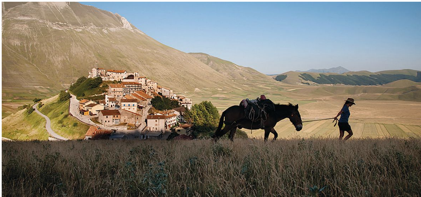
Una delle suggestive immagini di Steve McCurry dedicate all'Umbria con Castelluccio di Norcia

Indossa un abito medievale, un copricapo avvolto a turban-