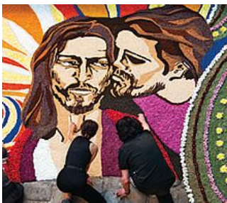
L'infiolata di Spello è stato uno dei momenti più importanti per il progetto di McCurry. Tutta la città si è data da fare nella notte per preparare un allestimento ad hoc.