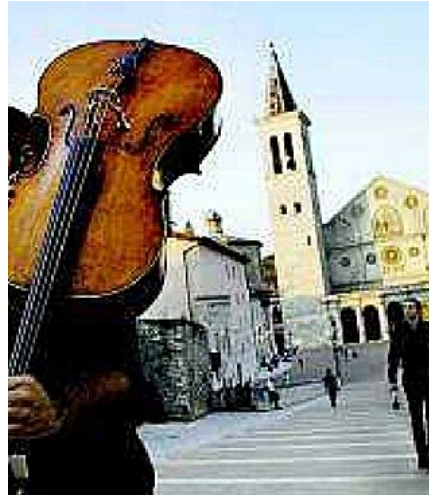
Particolari di alcuni scatti del fotografo Steve McCurry in mostra a Perugia