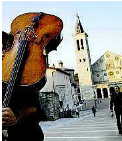
Particolari di alcuni scatti del fotografo Steve McCurry in mostra a Perugia